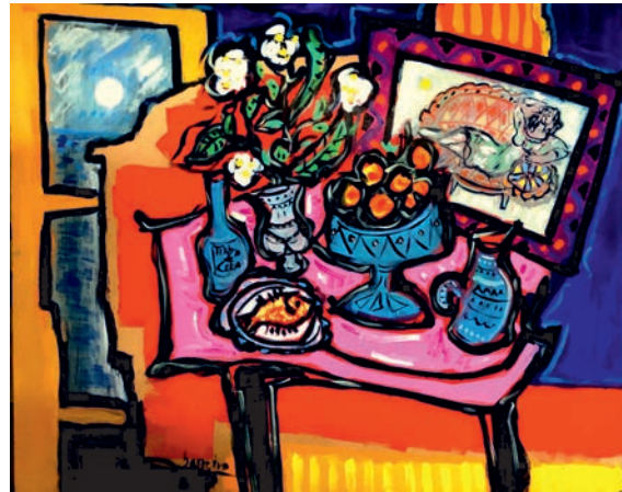
Luz del oeste óleo sobre madera 81 x 100 cm