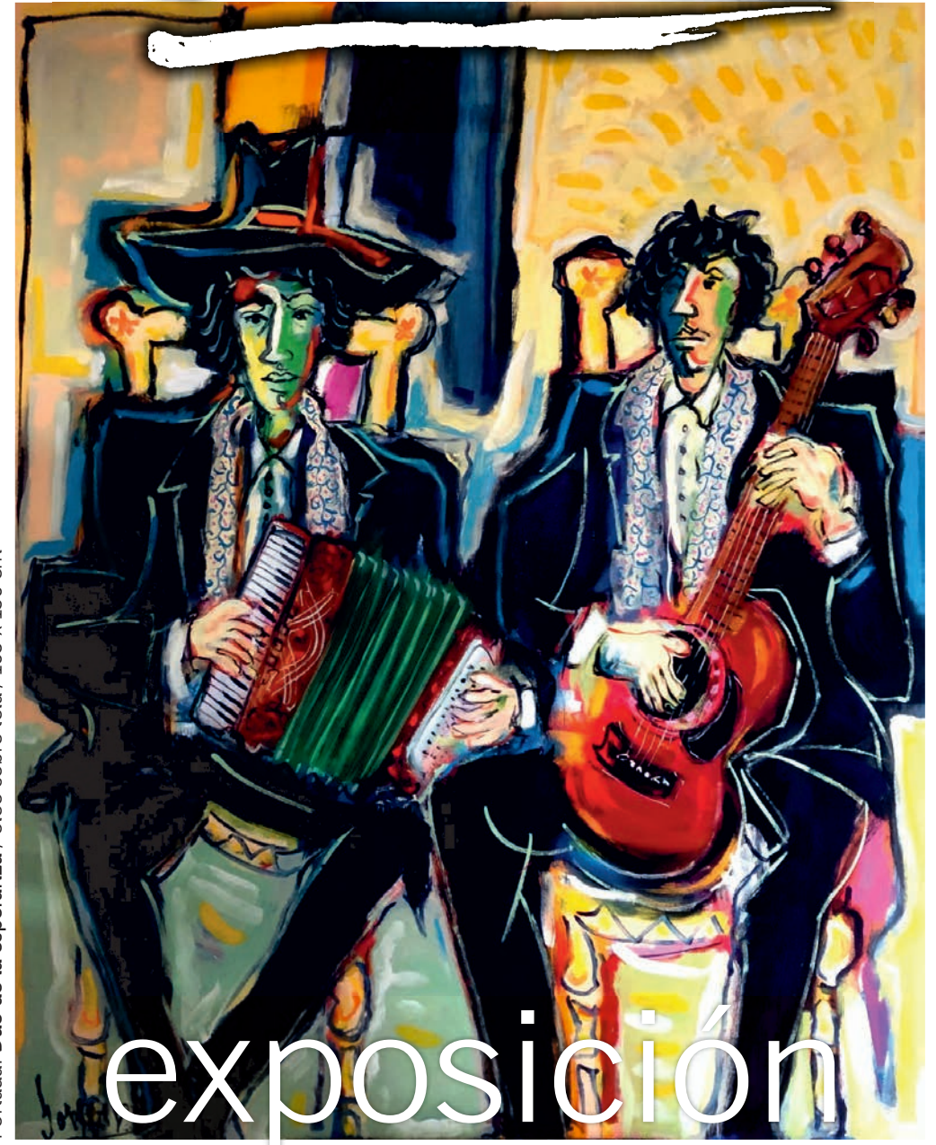
Portada: Duo de la esperanza / óleo sobre tela / 165 x 130 cm