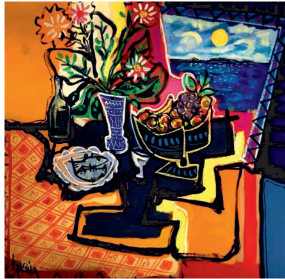
Atardecer en Cela óleo sobre madera 100 x 100 cm