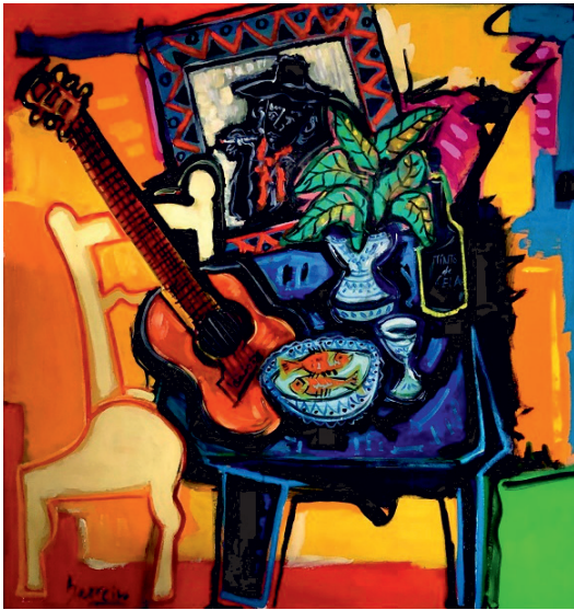
Un cigarro de relax óleo sobre madera 100 x 100 cm