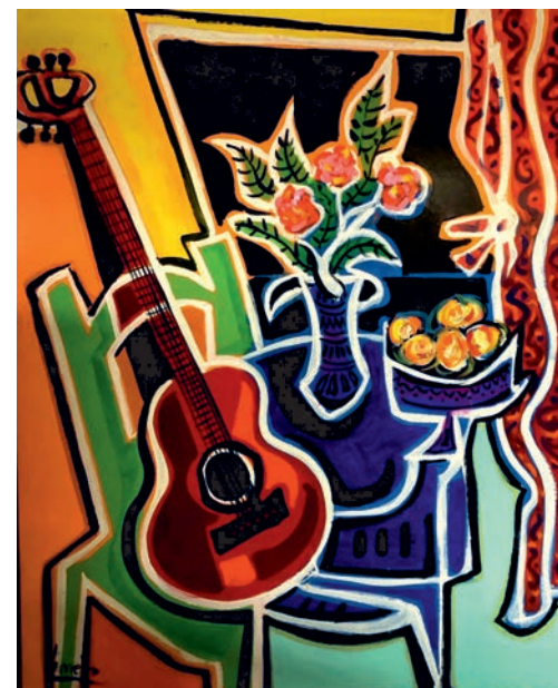
La guitarra óleo sobre madera 114 x 145 cm